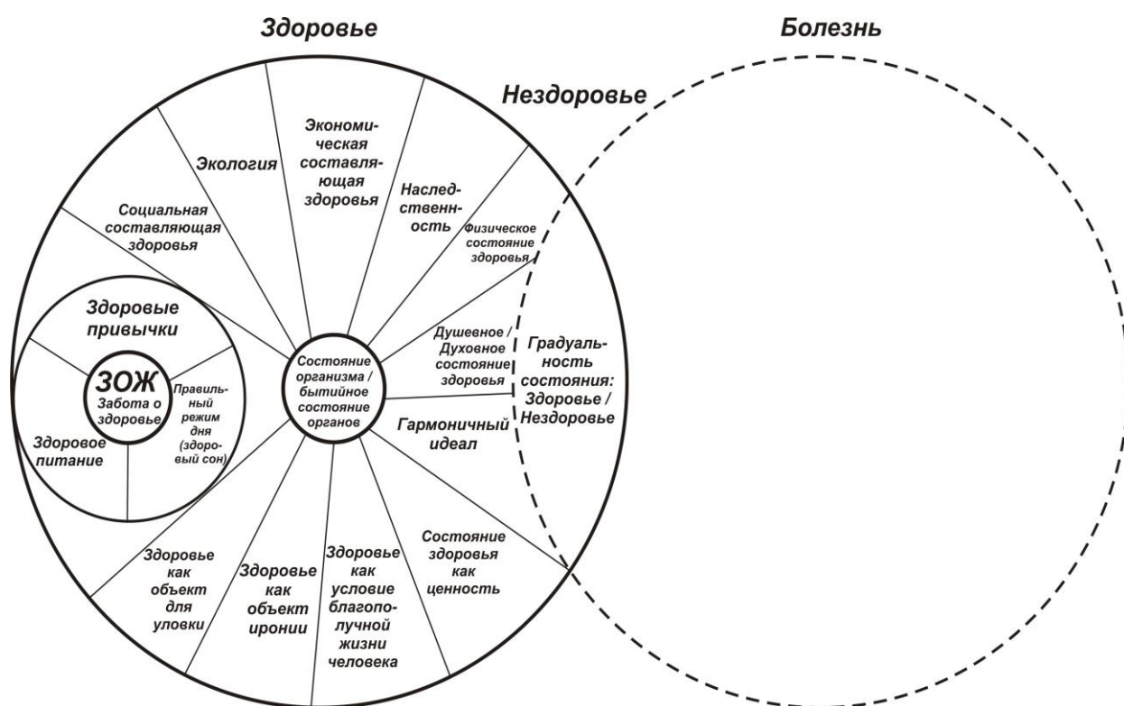
Рисунок 2. Структура концепта здоровье по данным словарей и психолингвистических экспериментов

Таким образом, анализ лексикографических источников, паремиологического фонда и данных психолингвистических экспериментов позволили определить структуру концепта здоровье и представить обобщенный список когнитивных классификационных признаков, формирующих структуру (см. рисунок 2).