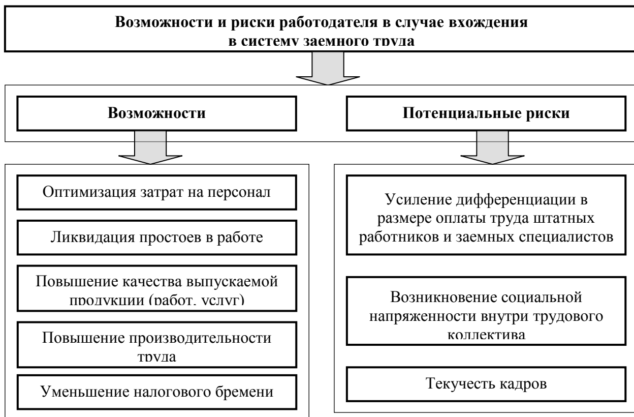
Рисунок 1 — Возможности и риски работодателя в случае вхождения в систему заемного труда