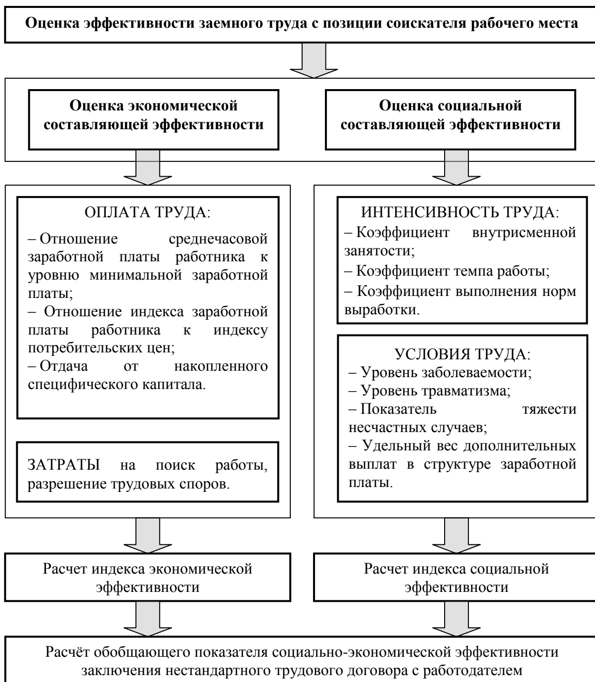
Рисунок 4 — Индикаторы оценки эффективности заключения нестандартного трудового договора с работодателем

С целью повышения эффективности будущего заемного труда соискатель должен применять экономический подход. Для оценки эффективности заключения нестандартного трудового договора нами предложено оценить четыре аспекта труда: его оплату, затраты, интенсивность и условия труда. Система показателей эффективности заемного труда с позиции соискателя рабочего места отображена на рисунке 4.