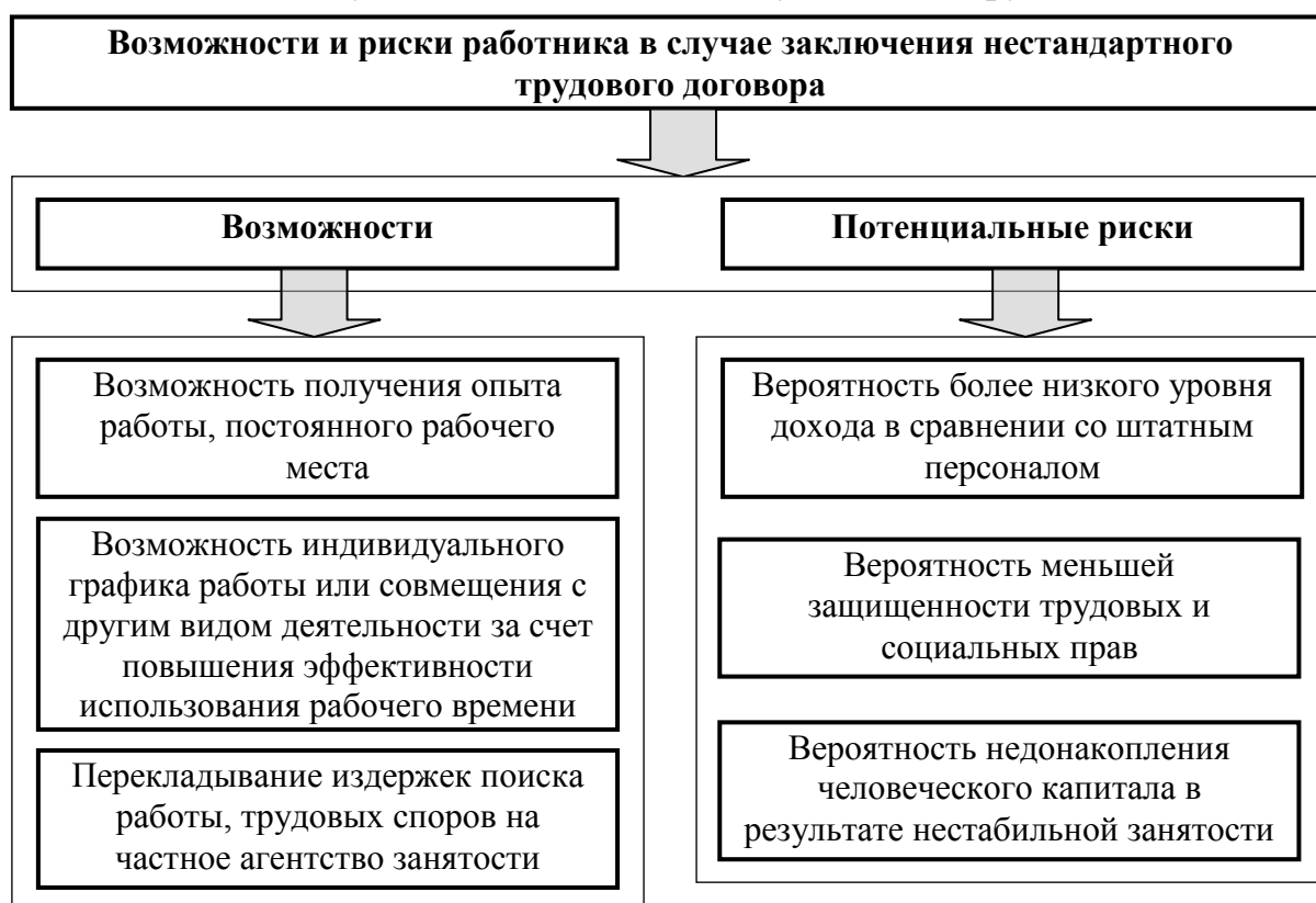
Рисунок 2 — Возможности и риски соискателя рабочего места в случае заключения нестандартного трудового договора с работодателем