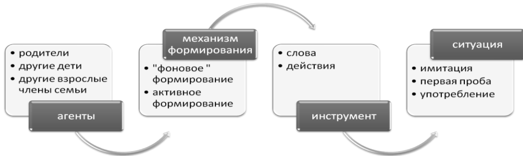
Рис. 3. Модель влияния семьи на формирование установки на потребление алкоголя у подростков

на формирование социальной установки 138 . Модель включает в себя следующие компоненты: агенты, механизм влияния, инструмент, ситуация (см. рис. 3).