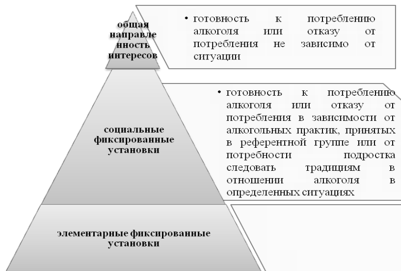
Рис. 2. Установка на потребление алкоголя в структуре диспозиций (на основании подхода В.А. Ядова)

В.А. Ядова, можно показать место установки на потребление алкоголя в диспозиционной структуре (см. рис. 2).