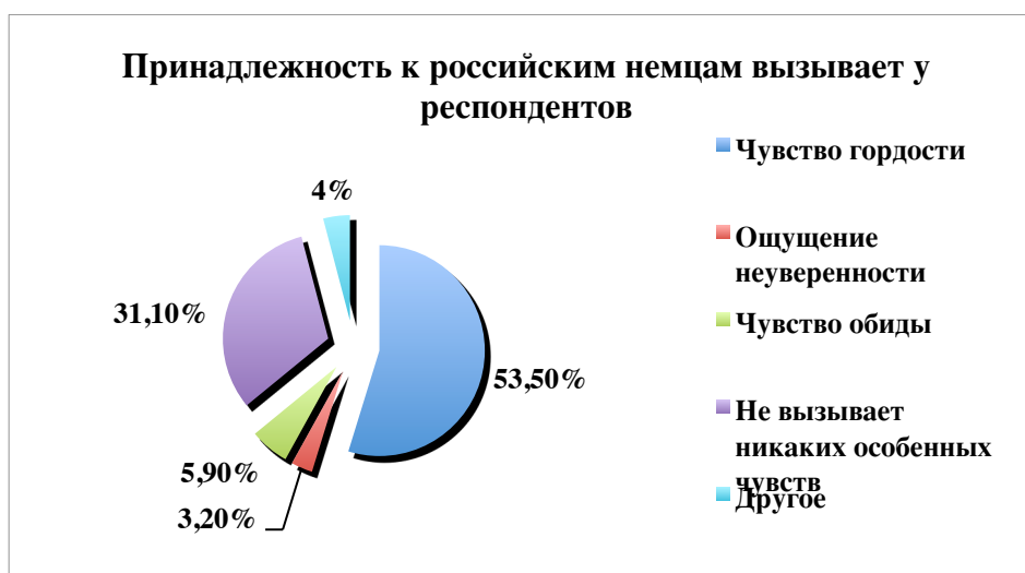
Диаграмма 1. Чувства, которые вызывает у российских немцев их этническая принадлежность.

При исследовании вопросов этноидентичности российских немцев важную роль для нас играл фактор отношения населения России к представителям изучаемого этноса.