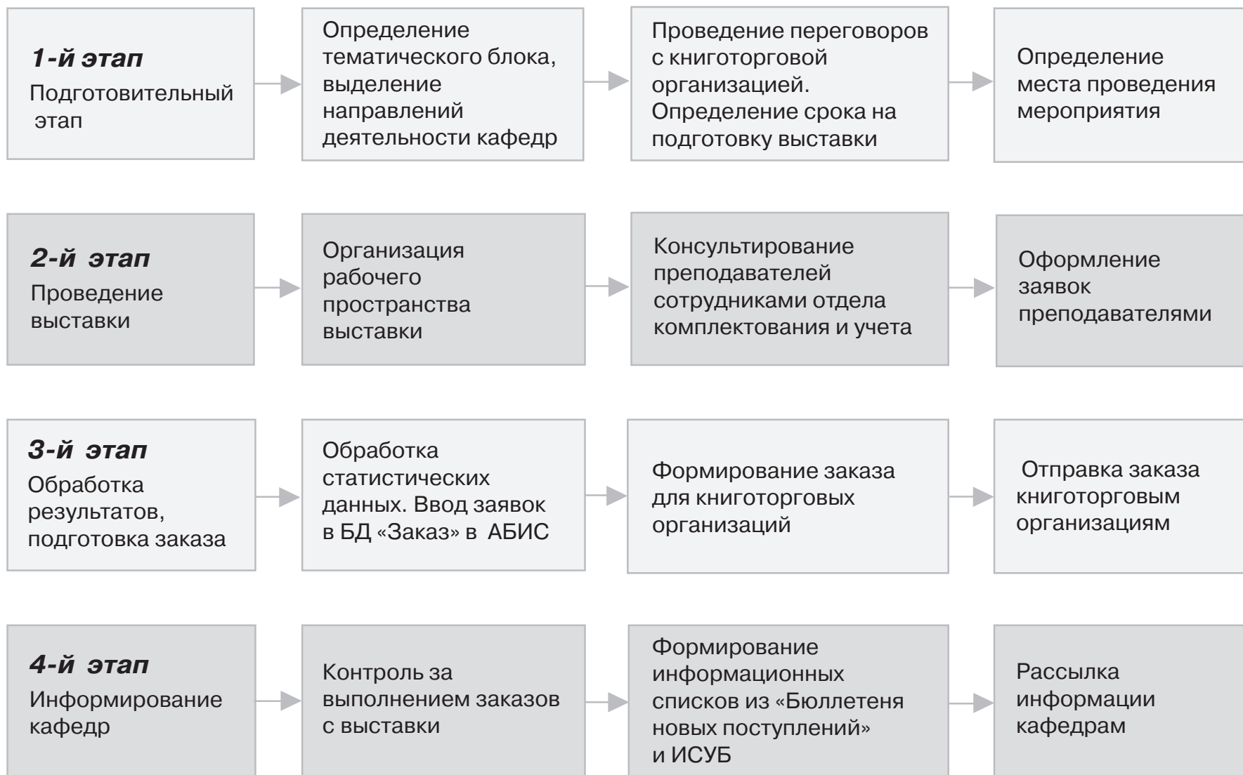
Рис. 1. Алгоритм проведения ассортиментных тематических выставок